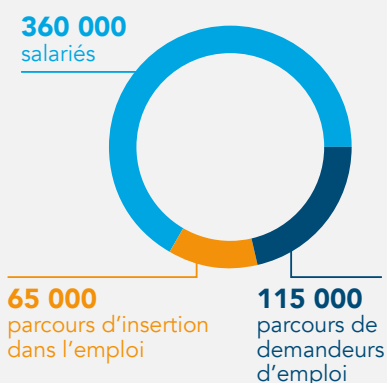
RÉPARTITION par public bénéficiaire (parcours financés par le FPSPP)